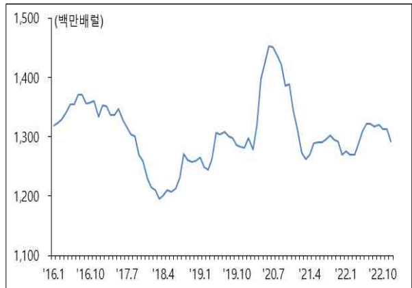
자료 : EIA, 'Short-Term Energy Outlook', Mar. 2021