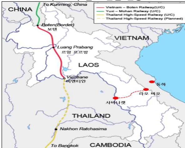
라오스의 철도 건설 현황

자료 : BMI Research(2019), 'Laos Infrastructure Report 4Q 2019'