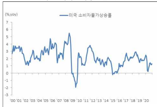
미국 소비자물가상승률 추이