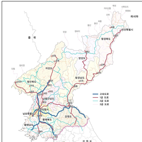
북한의 주요 도로망 현황