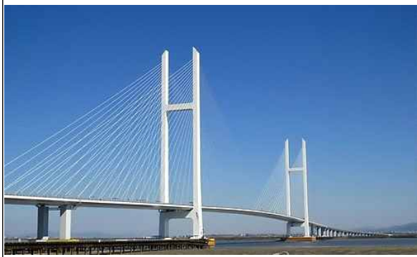
"북~중 신압록강대교, 개통 무기한 연기"